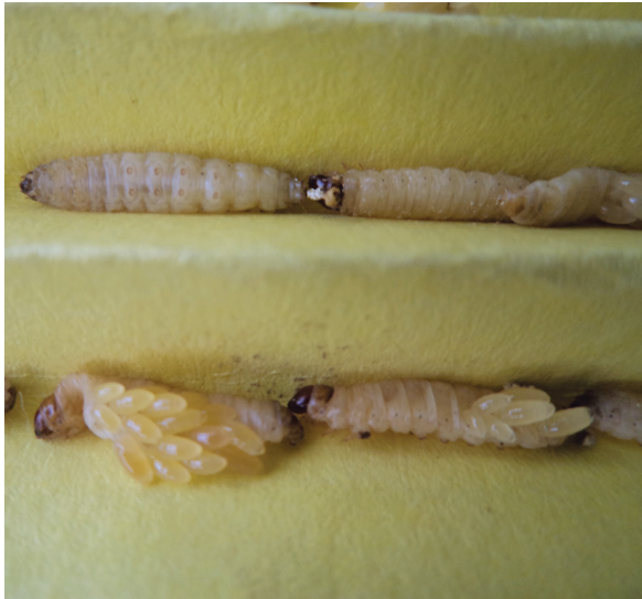
கோனியோசிஸ் புழு ஒட்டுண்ணி

கோனியோசிஸ், பிரகான் போன்ற புழு ஒட்டுண்ணிகள் நமது உயிரியல்