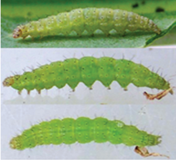
பேசில்லஸ் தூரின்ஜியன்சிஸ் தாக்கிய முட்டைக்கோசு வைரமுதுகுப் பூச்சி

அதை நீரில் கரைத்து பின்பு வடிகட்டி தண்ணீர் கலந்து மீண்டும் தெளிக்கலாம்.