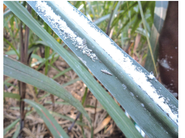
வெண்கம்பளி அசவினி மற்றும் எதிரி பூச்சி மைக்ரோமஸ்

அசவினிகள் கூட்டம் கூட்டமாக தோகைகளில் மட்டும் காணப்படும். இளங்குஞ்சுகள் வெளிர் மஞ்சள் நிறத்தில் இருக்கும். வளர்ந்த அசவினிகளின் மேல் வெண்ணிற கம்பளிப் போர்வை காணப்படும். வயதில் முதிர்ச்சியடைந்த அசவினிகள் கருமை நிறத்தில் இறக்கையுடன் காணப்படும்.