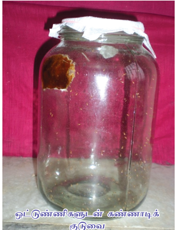
ஒட்டுண்ணிகளுடன் கண்ணாடிக் குடுவை

இரண்டு லிட்டர் கொள்ளளவுள்ள கண்ணாடி குடுவையினுள் ஒட்டுண்ணி ஆய்வகங்களில் இருந்து பெறப்பட்ட பிரகானிட் ஆண், பெண் ஒட்டுண்ணிகள் ஒவ்வொன்றும் 50 என்ற எண்ணிக்கையில் விட வேண்டும். தேன், வெல்லப்பாகுடன் குழைத்து தயாரிக்கப்பட்ட கரைசலில் தோய்க்கப்பட்ட பஞ்சினைக் கண்ணாடி குடுவையின் ஓரத்தில் ஒட்டி வைக்கவும். பின்னர் உறிஞ்சும் காகிதத்தை வட்ட வடிவத்தில் வெட்டி ஜாடியின் வாய்ப் பகுதியை மூடவும். இப்பேப்பரின் மீது 50 (கார்சைரா) நெல் அந்துப்பூச்சி புழுக்களை வைத்து அவைகளின் மீது வட்ட வடிவத்தில் வெட்டிய காடா துணியினால் மூடவும்.