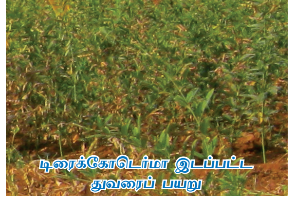
டிரைக்கோடெர்மா இடப்பட்ட துவரைப் பயறு

பயறுவகை பயிர்கள் பெரும்பாலும் மானாவாரியாக பயிரிடப்படுகின்றன. பயறுவகை பயிர்களில் நோயை கட்டுப்படுத்த இரசாயன பூஞ்சாண கொல்லிகள் பயன்படுத்துவதால் உற்பத்தி செலவு அதிகமாவதோடு மனிதர்களுக்கு சுகாதார கேடுகளும் ஏற்படுகின்றன. பயறுவகை பயிர்கள் பயிரிடும் உழவர்கள் நோய் கட்டுப்பாட்டிற்கு டிரைக்கோடெர்மா எதிர் உயிர் கொல்லிகளைப் பயன்படுத்துவதால் உற்பத்தி செலவு குறைவதோடு மண்ணின் வளமும், சுற்றுச் சூழலும் பாதுகாக்கப்படுகின்றன.