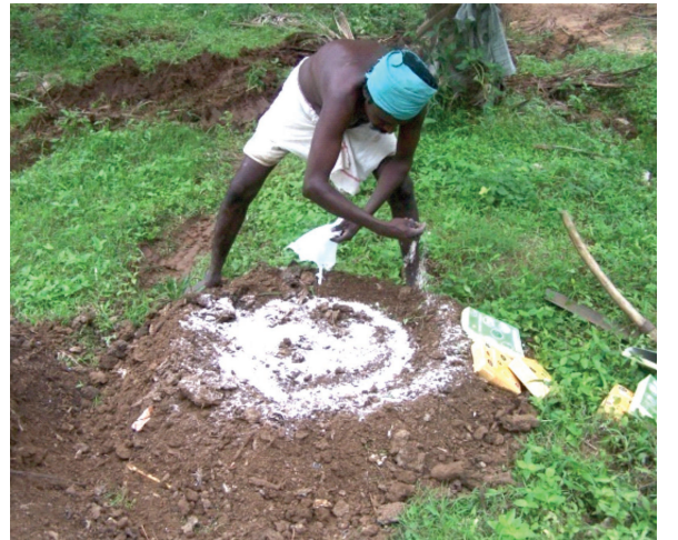
உயிர் எதிர்கொல்லி தூவுதல்

இந்நோய் மரத்தின் தண்டுப்பகுதியை சுற்றியே காணப்படும். மரத்தின் தண்டுப்பகுதியில் இருந்து மரத்தின் மேற்பகுதி வரை சிறிய வெடிப்புகள் தென்படுவதுடன் அதிலிருந்து செம்பழுப்பு நிற சாறு வடியும். நோய் முற்றிய நிலையில் தண்டுப்பகுதி முழுவதும் சேதமடைந்து மரமானது சரிந்து விடும்.