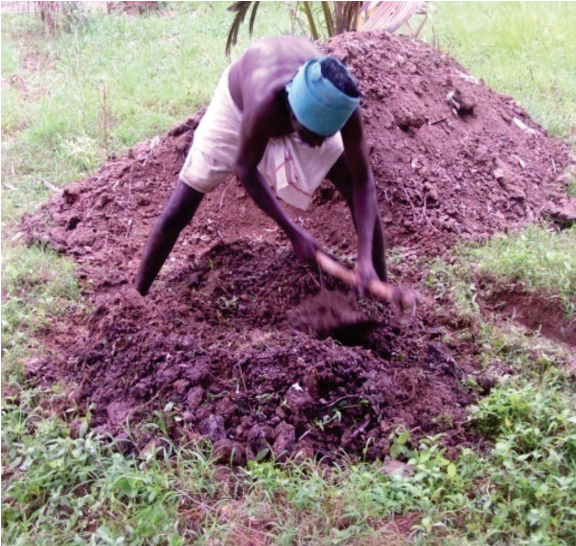
2-நாள் இடைவெளியில் மீண்டும் கலக்குதல்

சாறு வடிதல் நோயைக் குணப்படுத்த டிரைக்கோடெர்மா விரிடியை பசை போல் செய்து தண்டுப்பகுதியின் மேற்தோலை நீக்கி விட்டு தடவ வேண்டும். இலை அழுகல் நோயை குறைக்க 10 கிலோ தொழுஉரத்துடன் சூடோமோனாஸ் புளுரசன்ஸ், பேசில்லஸ் சப்டிலிஸ், டிரைக்கோடெர்மா விரிடியை 100 கிராம் என்ற சம அளவில் கலந்து மண்ணில் இட்டு உடனடியாக தண்ணீர் விட வேண்டும்.