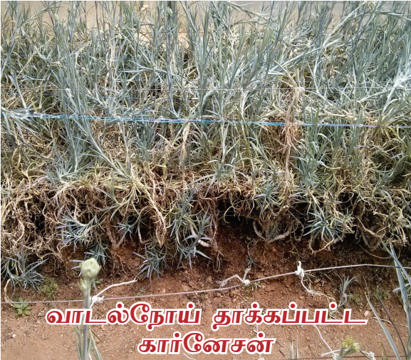
வாடல்நோய் தாக்கப்பட்ட கார்னேசன்

சேதம் அதிகம் உள்ள செடிகளில் வேர்ப்பாகம் அழுகி காணப்படும். பின்னர் பாதிக்கப்பட்ட செடி முழுவதும் காய்ந்து காணப்படும். இச்செடிகளில் உண்டாகும் பூக்களின் இதழ், இதழ்களின் அமைப்பு, தோற்றம், வண்ணங்கள், காம்பு வளர்ச்சி ஆகியவை சிதைந்து காணப்படும். இதனால் பூக்களின் தரம், சந்தை மதிப்பு குறைந்து விடுகின்றது.