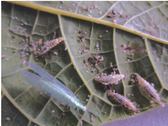
பச்சை கண்ணாடி இறக்கை பூச்சி மற்றும் புழு

வளர்ந்த பூச்சிகள் பூவில் உள்ள தேன், மகரந்தம், பூச்சிகள் சுரக்கும் ஒருவகை தேன் போன்ற திரவத்தை மட்டுமே உண்டு உயிர் வாழும். கண்ணாடி இறக்கை பூச்சியில் பல வகைகள் இருந்தாலும் கிரைசோபெல்லா ஜஸ்டிராவி என்ற வகை நம் நாட்டில் பரவியுள்ளது. இது பருத்தி