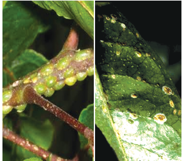
வெர்டிசிலியம் லிக்கேனி பூசணம் தாக்கிய காப்பி பச்சை செதில் பூச்சி

பூச்சிகளைக் கட்டுப்படுத்துவதில் சிலவகை நச்சுயிரிகளும் முக்கிய பங்கு வகிக்கின்றன. நியூக்ளியர் பாலிஹெட்ரோசிஸ், கிரேணுலோசிஸ் நச்சுயிரிகள் பயிர்களைத் தாக்கி அதிக சேதம் விளைவிக்கக்கூடிய சில முக்கியமான பூச்சிகளை சிறந்த முறையில் கட்டுப்படுத்தக் கூடியவை. பச்சைக் காய்ப்புழு (ஹீலீயோத்திஸ் புழு) சிவப்பு கம்பளிப் புழு, புரோடனியா புழு, அக்ரோட்டிஸ் புழு போன்றவற்றை கட்டுப்படுத்தக் கூடிய நியூக்ளியர் பாலிஹெட்ரோசிஸ் நச்சுயிரிகள்