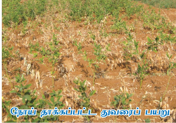
நோய் தாக்கப்பட்ட துவரைப் பயறு

வேரழகல் நோய் அதிக வறட்சி காலங்களில் தீவிரமடைவதால் மக்கிய தென்னை நார்க்கழிவு மண்ணின் வறட்சியைக் குறைத்து, ஈரப்பதத்தை அதிகரித்து மண்ணின் தன்மை, மண்ணிலுள்ள நன்மை செய்யும் நுண்ணுயிரிகளின் எண்ணிக்கையை பெருக்குவதால் வேரழகல் நோய் வெகுவாக குறைகின்றது.