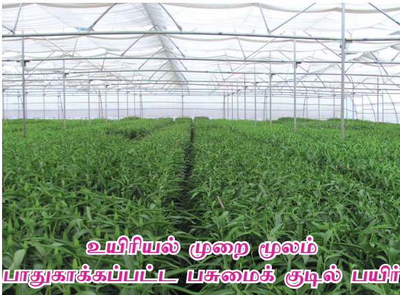
உயிரியல் முறை மூலம் பாதுகாக்கப்பட்ட பசுமைக் குடில் பயிர்

நோய் தாக்கப்பட்ட இலையின் நுனிப்பகுதி மஞ்சள் நிறமாக மாறி, பின்பு சறுகு போல காயும். காய்ந்த இலையின் மேல் கறுப்பு நிற பூசண வித்துகள் காணப்படும். சில நேரங்களில் பூக்களிலும் காணப்படும். இதனால் முதல் தரம் கொண்ட பூக்களை உற்பத்தி செய்ய இயலாது. கூடுதலாக சந்தைப்படுத்தலும் கடினமாகிவிடும்.