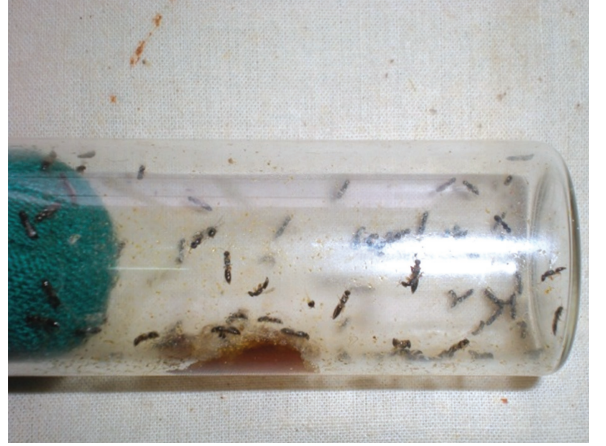
கோனியேசல் வைத்திலிட் ஒட்டுண்ணிகள் கண்ணாடிக் குடுவைகளில்

பின்னர் தேர்ந்தெடுக்கப்பட்ட ஒவ்வொரு தென்னை மரத்தின் உச்சியிலும் 100 பூச்சிகள் கொண்ட பிரக்காணிட்