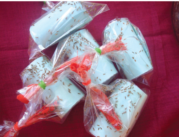
பிரக்காணிட் ஒட்டுண்ணிகள் பாக்கெட்டுகளில்

பிரக்காணிட், பெத்திலிட் ஒட்டுண்ணிகள் தென்னை ஆராய்ச்சி நிலையம், ஆழியார் நகரில் ரூ. 50/- (100 பிரக்காணிட் ஒட்டுண்ணிகள்), ரூ. 90/- (100 பெத்திலிட் ஒட்டுண்ணிகள்) என்ற விலைகளில் தென்னை உழவர்களுக்கு வழங்கப்படுகின்றன. தேவைப்படும் தென்னை உழவர்கள் ஆராய்ச்சி நிலையத்தை அணுகி கேட்டுப் பெறலாம்.