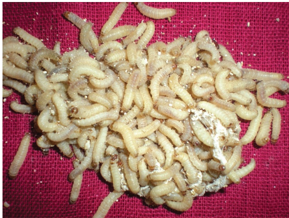
கார்சைரா (நெல் அந்துப் பூச்சி) புழுக்கள்

இரண்டு, மூன்று நாட்கள் கழித்து கார்சைரா முட்டைகள் நெல் அந்திப் பூச்சி முட்டை இடும் கலனில் இருந்து சேகரித்து வைத்துக் கொள்ள வேண்டும். பின்னர் தொடர்ந்து கார்சைரா புழு அந்திப்பூச்சி உற்பத்தி செய்யும் தானியக்கலவையில்