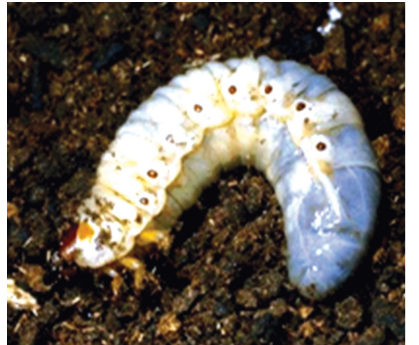
பவோரியா வெள்ளைப் பூசணம் தாக்கிய புழுக்கள், வண்டுகள்

வைரஸ் கலவையை செடிகளின் எல்லா பாகங்களிலும் முக்கியமாக இலைகளின் அடிபாகத்தில் நன்றாக படும்படி தெளிக்க வேண்டும். வைரஸ் நோய் தாக்கிய புழுக்களை சேகரித்து,