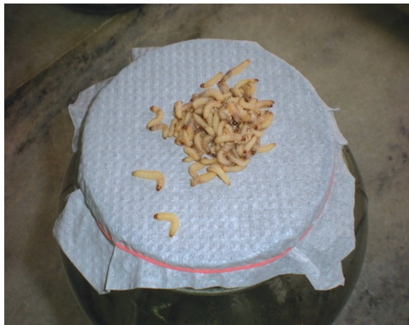
குடுவையின் மேல் விடப்பட்ட புழுக்கள்

இவற்றலிருந்து வெளிவரும் பிராக்கானிட் ஒட்டுண்ணியின் புழுக்கள் கார்சைரா புழுக்களைத் தாக்கி ஒரு வாரம் வரை உண்டு வாழ்கின்றன. பின்னர் கூட்டுப்புழுப் பருவத்தினை மூன்று நாட்கள் கழிக்கின்றன. வட்ட வடிவ உறிஞ்சும் காகிதங்கள் மீது இருக்கும் கூட்டுப்புழுக்களைப் பிரித்தெடுத்து தனியாக வேறு கண்ணாடி குடுவையினுள் வைத்து விட வேண்டும். இக்கூட்டுப்புழுக்களில் இருந்து வெளிவரும் பிராக்கானிட் ஒட்டுண்ணிகளைக் கருந்தலைப்புழு பாதிக்கப்பட்ட தென்னந்தோப்புகளில் விட வேண்டும்.