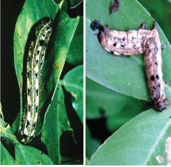
நியூக்ளியர் பாலி ஹெட்ரோசிஸ் நச்சுயிரி (என்.பி..வி) தாக்கிய புரோடனியா புழு (என்.பி..வி)

வெப்ப நிலையும் காணப்படும் போதுதான், பூசணக்கொல்லியும் நன்கு செயல்படும். ஆகவே, மழைக்காலங்களில் இப்பூசணம் நல்லபயனைக் கொடுக்கும்.