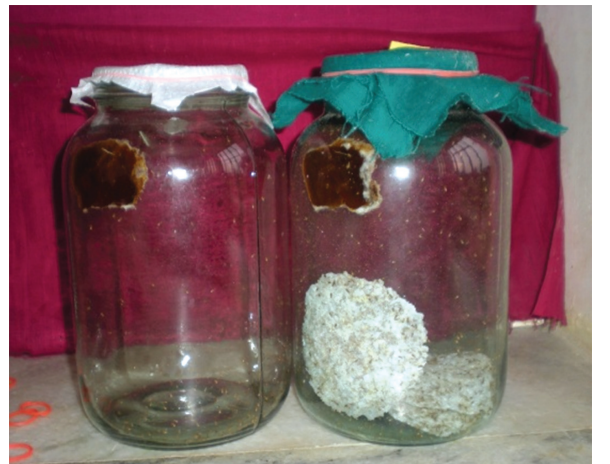
குடுவையில் வைத்த பின்னர் காடா துணி கொண்டு முடுதல்

பின்னர் பஞ்சுடன் சுற்றி உருவாக்கப்பட்ட துணி அடைப்பானைக் கொண்டு அடைத்து வைத்துவிட வேண்டும். இரண்டு வாரங்கள் முடிந்த பிறகு இப்புழுக்களில் இருந்து கோனியோசஸ் (பெத்திலிட்) ஒட்டுண்ணிகள் வெளிவரும். அவற்றை சேகரித்து கருந்தலைப்புழு தாக்கப்பட்ட தென்னந்தோப்புகளில் விட வேண்டும்.